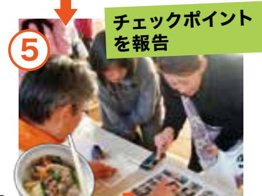
宇都の ふるまい付♪