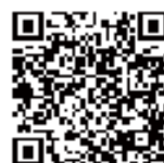
土佐のまほろば 風景街道 公式HP